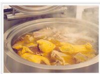
Brodo per Tortellini

- 4 uova di gallina fresche di guscio scuro gr 60/65 PREPARAZIONE: